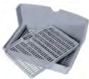
DOS OPCIONES DE FILTRO / TWO FILTER OPTIONS