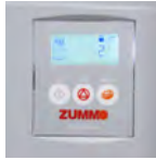
PROGRAMADOR Y CONTADOR DIGITAL PROGRAMMER AND DIGITAL COUNTER