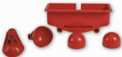
KIT COPAS GRANDES KIT LARGE CUPS