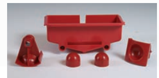
KIT MANDARINA / TANGERINE KIT (*)