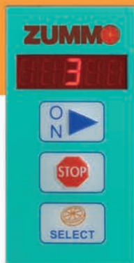
PROGRAMADOR Y CONTADOR DIGITAL PROGRAMMER AND DIGITAL COUNTER