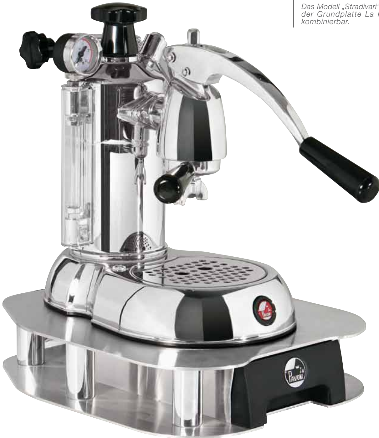
SET STRADIVARI - SPL/BX

Das Modell „Stradivari“ ist mit der Grundplatte La Pavoni kombinierbar.