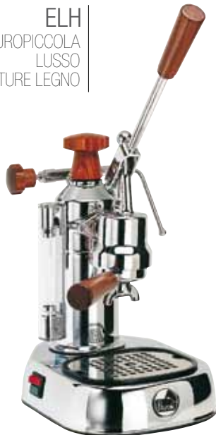
ELH EUROPICCOLA LUSSO IMPUGNATURE LEGNO