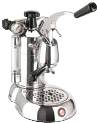
SPL - STRADIVARI PROFESSIONAL LUSSO