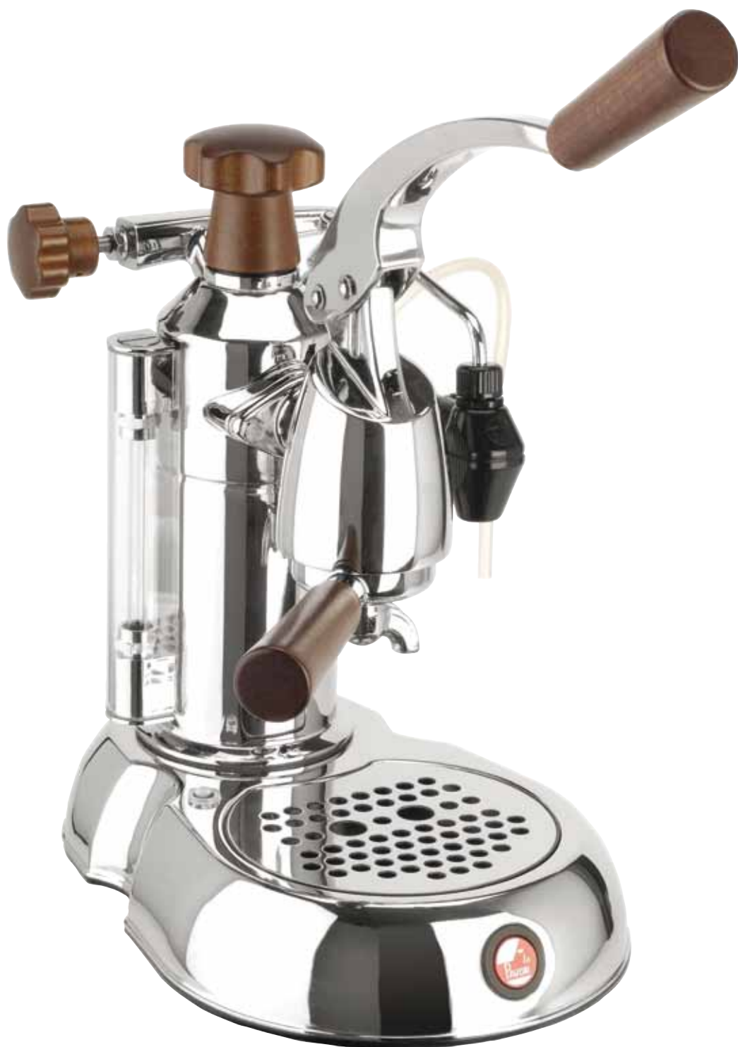
STH - STRADIVARI PROFESSIONAL LUSO IMPUGNATURE LEGNO