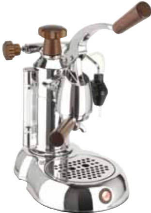
STH - STRADIVARI LUSSO IMPUGNATURE LEGNO