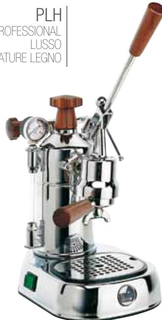
PLH PROFESSIONAL LUSSO IMPUGNATURE LEGNO