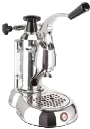
STL - STRADIVARI LUSSO