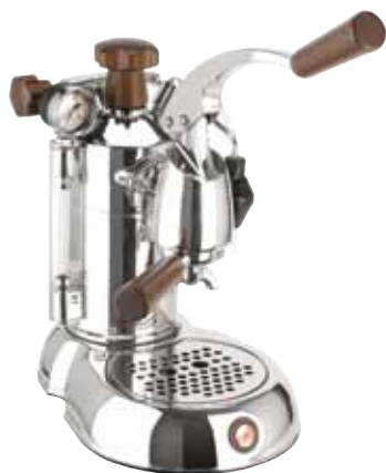
SPH - STRADIVARI PROFESSIONAL LUSSO IMPUGNATURE LEGNO

Il modello Stradivari è stato studiato ispirandosi al violino, strumento musicale per eccellenza reso opera d'arte dal famoso liutaio di Cremona Antonio Stradivari.