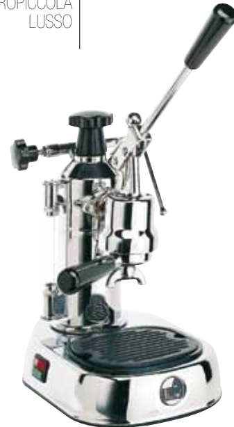
EL EUROPICCOLA LUSSO